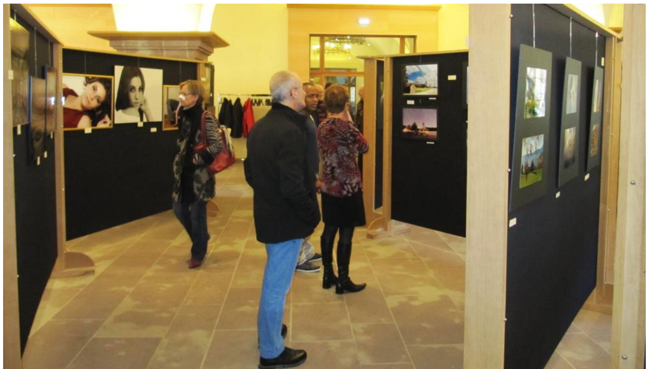
Les visiteurs ont pu admirer 275 clichés pris par une vingtaine de photographes.

► Contact : pierre.yves.muller@hotmail.fr