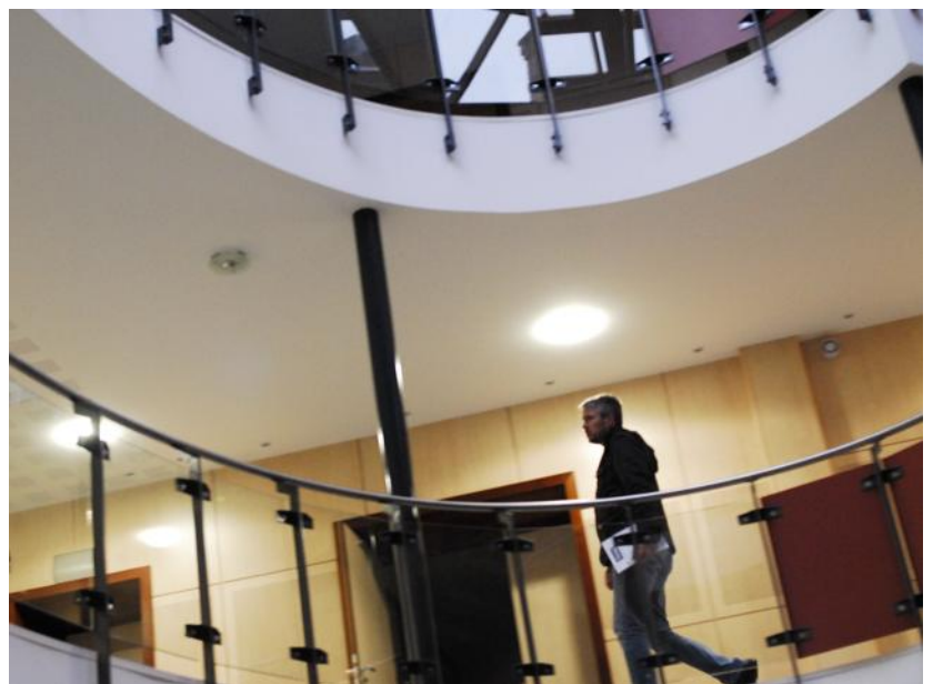
Portes ouvertes aux porteurs de projets.